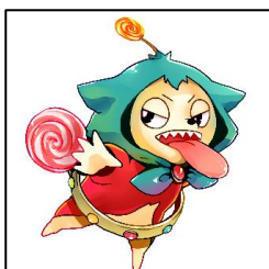
キューティ・エイリアン ペロロ オプション購入：有料 ¥2,900(税込)

大人しく優しい性格の女の子。あまり多くを語らないためパーソナルな部分は基本的には誰にも分からない。水瓶座の16歳。