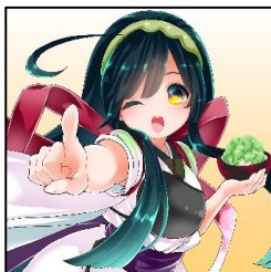
東北ずん子 (CV 佐藤聡美)

音楽のある生活が大事ってことを教えに、くりむ星から地球に来た音楽種族。横線の前で浮かんでいるのが大好き。鼻歌が得意。