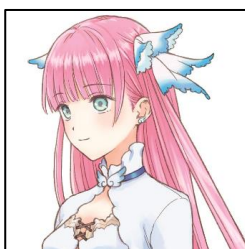
声乃ツバサ (CV 小岩井ことり)

ずん다가大好き！17歳、ふるさと女学院高等部2年生。ずんだアローというあらゆるお餅をずんだ餅にする必殺技を持っている。